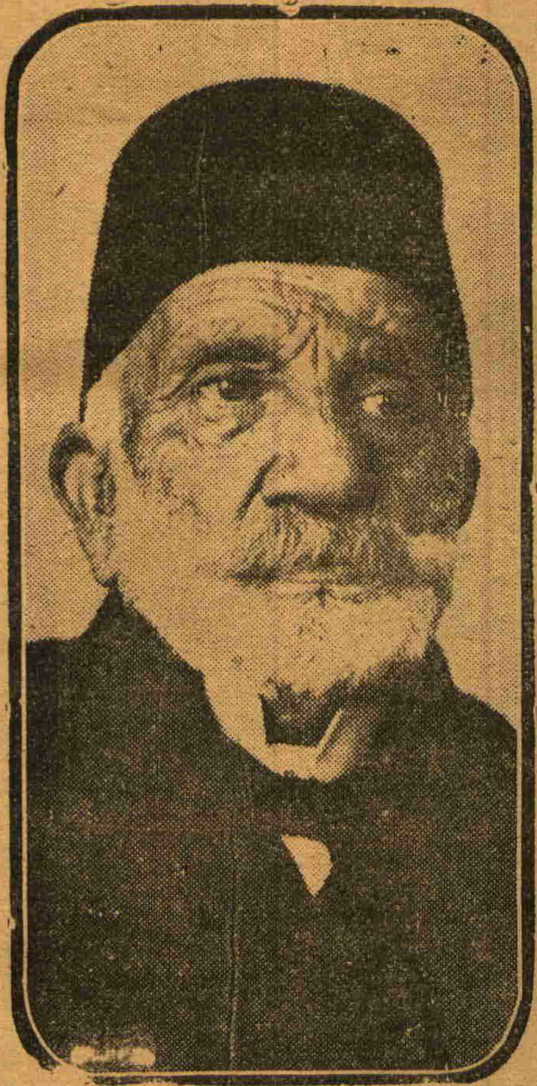
مظهر پاشا فا کولته خواجه لغنده ایکن

مشروطیتدن سوکره مکتب طیبیه شاهانه برچوق فریاد و ولوله لرایله بو کونکی طب فا کولته سنی دوغوردی . هر شیشی ده کیشدیرمک ایستین عصبی بر جریان تشریح درسده کنج و فعال برخواجه تعین ایدلسنی طاسارلادی و اوتوز سنه دن بری تشریح او قوتان اصیل و مبجل خواجه نک او کسور و کار ایله منقطع سسی قیصایمق ایسته نیلیدی ؛ او ، وقور و محتشم ، بتون بو حرمتسر جریانلره قارشی هضم اغیرار ایدیور ، بتون بوتقانی کچیجی و هر جانی بر فورطنه کبی تاقی ایدیوردی . حال بوکه ، مظهر پاشا طیبیه مکتبندن بر آرز یوکلی و سرمایه لی اوله رق چیقمش اولان هر کنج طیبیه ینه او مکتبده مفید بر خدمت ، قابلیتنی تجلی ایتدیره جک بروطفه و موقع بولمق ایچون سنه لرجه دیدینوب قوشمش و بتون طلبه سنی شفقتلی و منور بر بابا حسیه دایما و دایما سومش ، کندنده اثر لیاقت کوردیکی هیچ بر تلینندن قدر آشنالغنی اسیرکه مه مش خیر خواه بر خواجه عفو و مسامحه سیله بتون او کور و اولورک صوکنی بکله دی و نهایت انقلاب بچلره کندیسنک ده مثبت بر قوت اولدیغنی ونه دینسه و یاپیلسه درس خانه سندن ، نمش باشندن و تشریح خانه سندن آیریله میه جغنی و خزینه قواسنک هنوز بوشالما دیغنی آ کلامغه موفق اولدی و برچوق جدالاردن سوکره عسکر لکنندن و خواجه لغندن متقاعد و فقط ینه تشریح خانه ده و درس خانه ده بالفعل خواجه اغنه صاحب عد ایدلی ، بو دوره حیاتنده درس کونلری ایکی کره طوب .