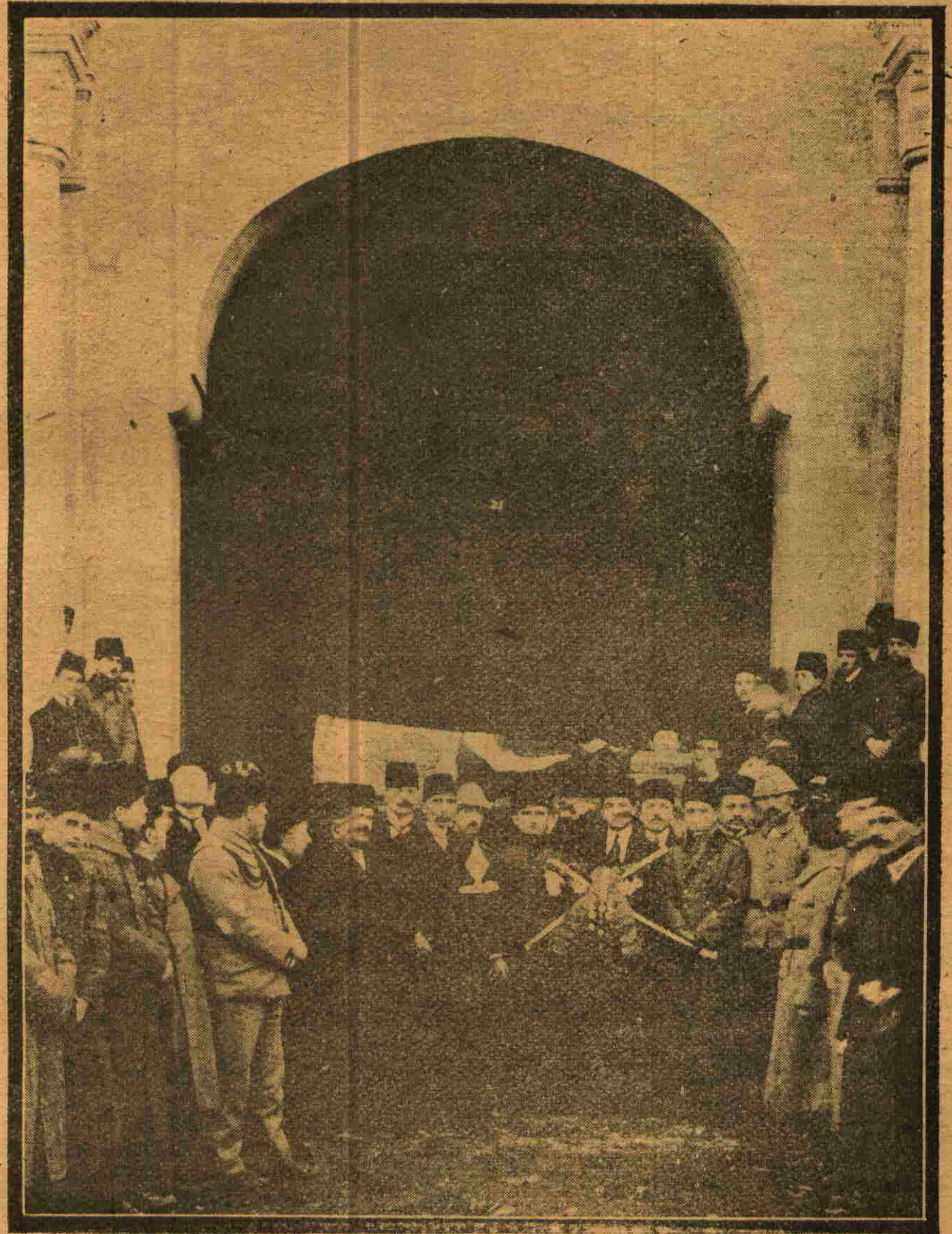
فاكولته اوكنده نطقل ابراد ايديلركن شديد بر تاثر اويانديردى . غائله طيبه من كندى جدا بدبخت و ... يالكز حس ايتدى . مرحومك تابوتى اوكنده اظهار ايديلن تاثر ماتمرك نه قدر عميق اولديغنى هر كسه و .. ينه بزه آكلاندى . كندى صلبندن دنيايه كنن اوغليله برابر اختيار كننج دوكتورلرده اغلاپوردى .

تشریح خواجه من مظهر پاشانك وفاتی هممزمده