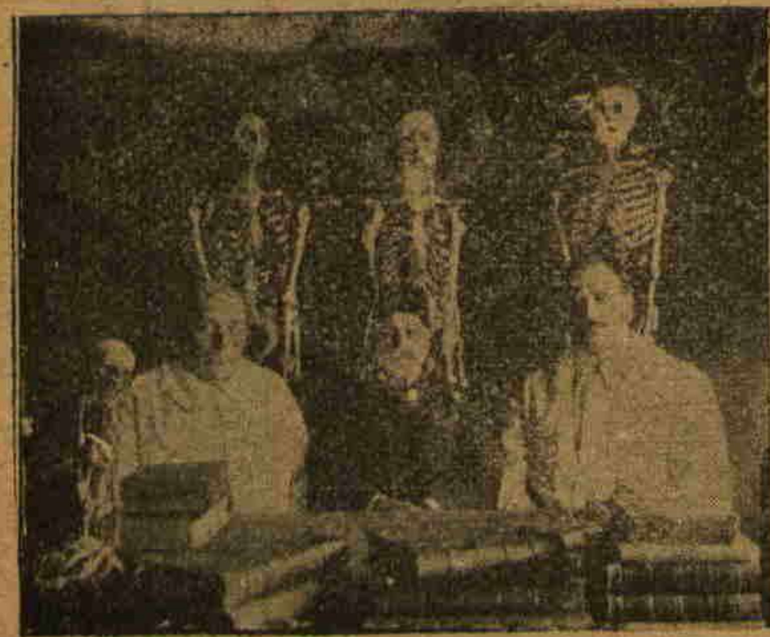
ینه محله سنده اسکیمی کبی بر خیر کار ، مراجعت ایدنلره ایشار شفقته حاضر مجانی بر فقرا طبیی

و ناکور بر مشغله در . . . تشریح خواجه سی مظهر پاشا اولجه دیشار یدنه يك از اجرای طبابت ایتمش و منابع وارداتی دائماً عسکرلک مخصوصاتنه منحصر قلمش و صوك زمانلرده تقاعد معاشرلینك متوالی تنقیح و تنزیلیری فلک زده خواجه مزك صوك کونلرینی براز صیقمش و آجینمش ، فقط نه ده اولسه هیچ بر حرمان و خسران اوکنده بویون آکه بن اوممتاز سپاده ینه بارز بر شکایت و تألم اثری کورولممش و او ،