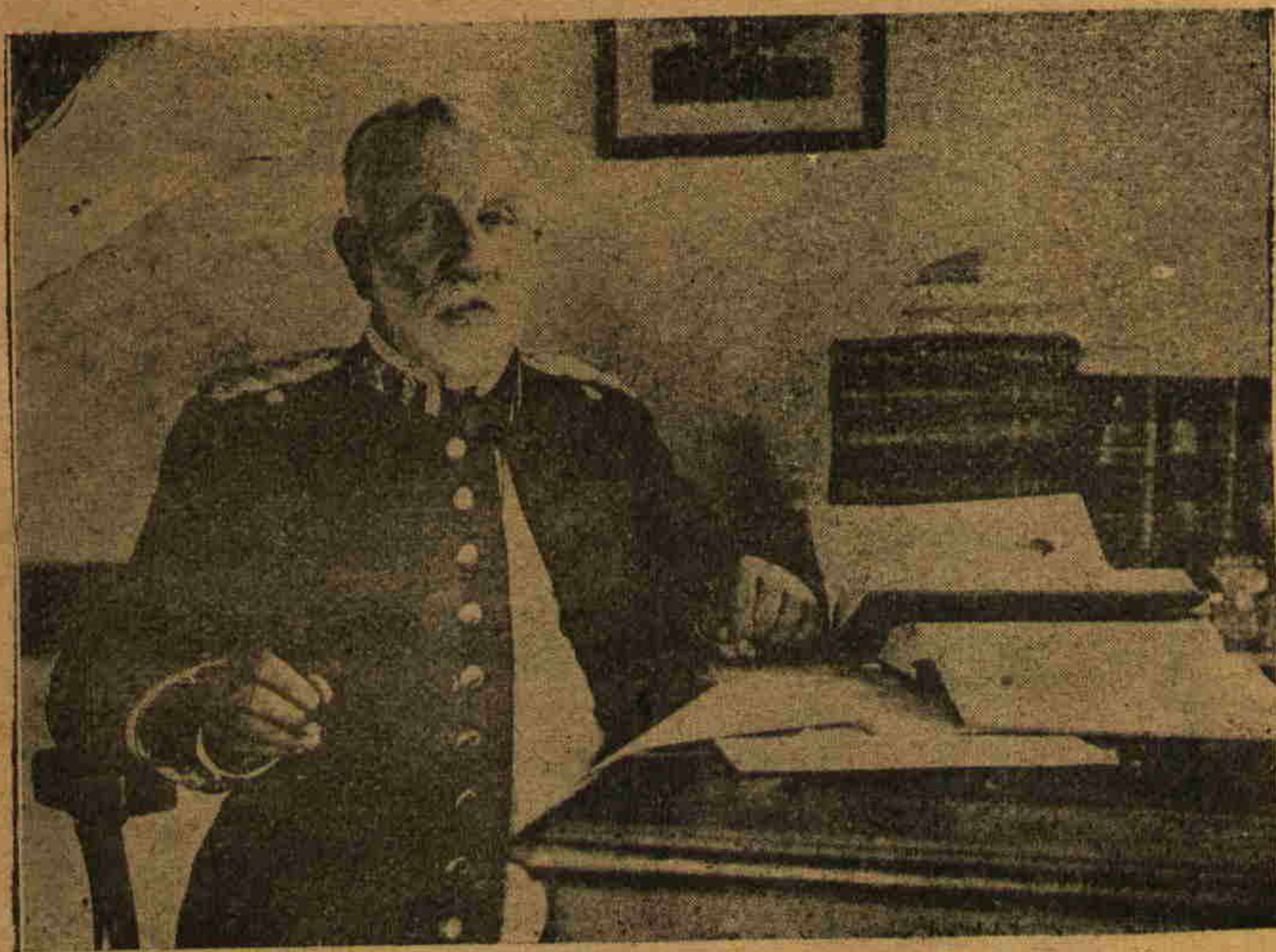
مظهر پاشا تقاعد اولاندن

و بی امان محرومیتلری و محیطمزمک مادی تقدیر کارلقده کی شایان اتهام اهل و مسامحه لری اولماسه ایدی ، - هپ عینی طرزده ، امین و نیکیبن ، تمادی ایدوب کیدیوردی . شو صوک کونلرده بن کندی حیاطنده هیچ بر شینک بی اونک یوموشاق و بر آرز بوروشمش آلرینی اویمک و بزنی کورنجه کوزلرنده تجلی ایدن مطمئن و بهشتی ابتهاج و ایتسامک روحانی تأثیری آلتنده مافوق الحیال برمنونیت طامق قدر متلذذ و شادکام ایلدیکنی بیامه یورم . بیاض ، نورانی و ایپکله قدر زمین بر صقالک چر چیوم . لیدیکی اونجیب و ممتاز چهره یی ، او مشفق ، درین و بر اق کوزلری ، او منبسط و مطرد یورو پوشی کوزمک او کنه کتیرنجه دایما خیالات تشریح خانه ده کی ایلمک هیجانلریمه عودت ایدر و اونی بم بیاض کوملکی ایچنده و حرمتکار طلبه سی آرسنده فخور و شا- دان ، النده دستره و چکیچ ، دیننده