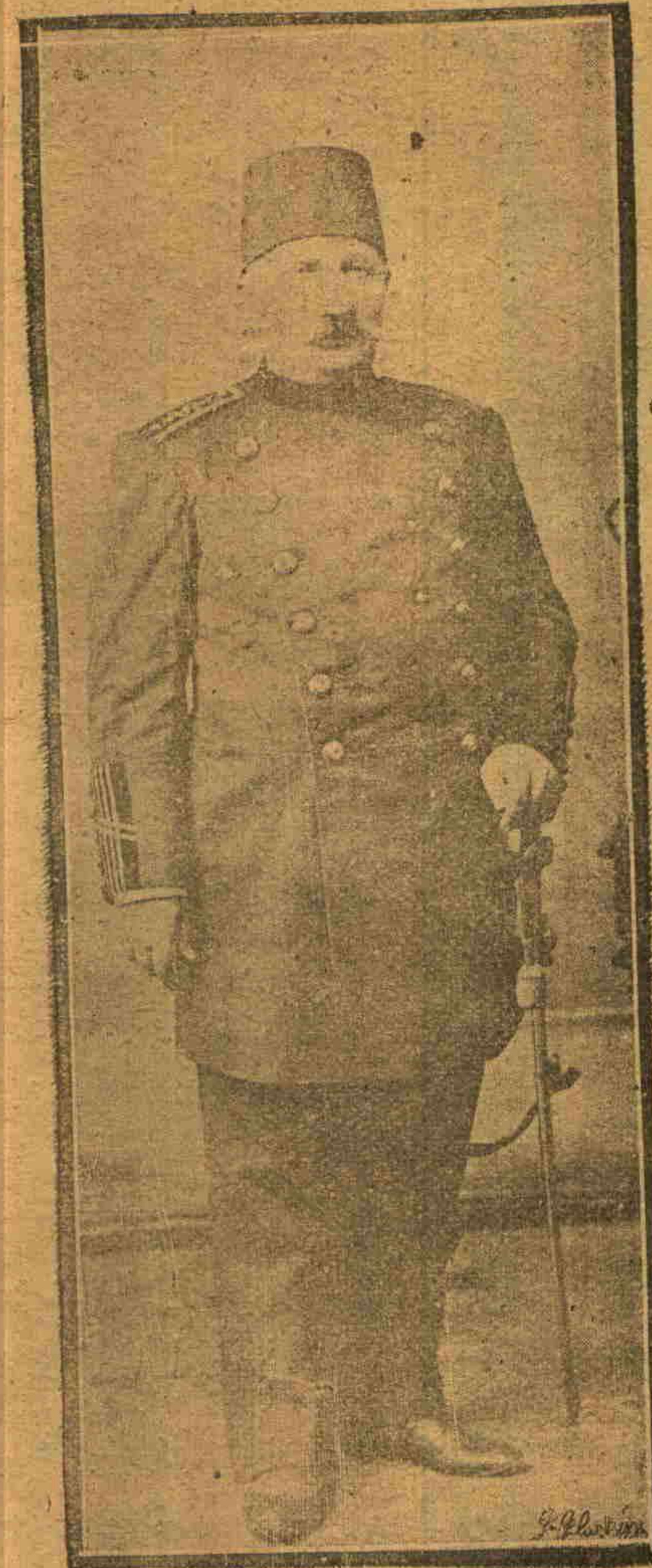
قامقم مظهر بک

بروقوف ایدینه جک درجه ده او کره ندکدن وهرجه تله اکل محصل ایلدکن صوکره مملکتنه دو نمش ، عسکری جراحنغیله بوسنه وقاره طاغ حرب جهه لرینه کوند رلمش بولیورز مظهر بکی پارسده کی ایجه ، ظریف ومدنی حیاندن حرب جهه سنده بعضاً بینک حیوانلریله بر آرده ایسلی وخراب چاتیلر آتمده یا تمغه