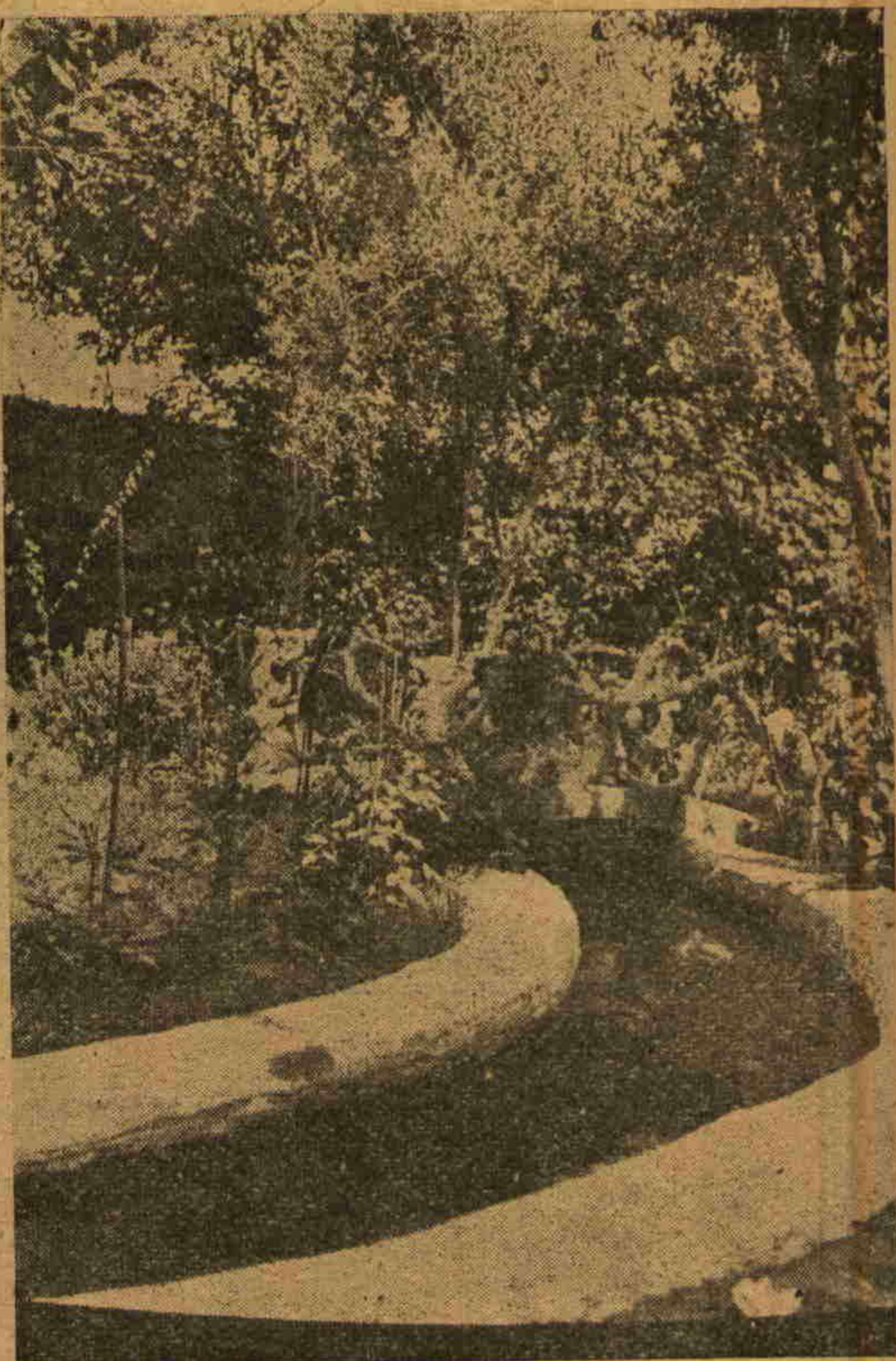
مظهر پاشانک بک سویدیکی بچه سی

دور حمیدینک صوک سر عسکری بو معامله نک تخطرنندن متحصل انفعالی مشرح معظم مزک رتبه ترقیاتی اوکنه منحوس برسد حائل شکننده دیکدیکی حالده خواجه مز یته فتور کتیرمه مش ودوستاغنه ، قدر شناساغنه قارشی دائماً شکرانگذار اولدیغی اوزمانک مابین ارکان حربیه مشیری شا کر پاشا مرحومک وفا کارلنی وصیمی