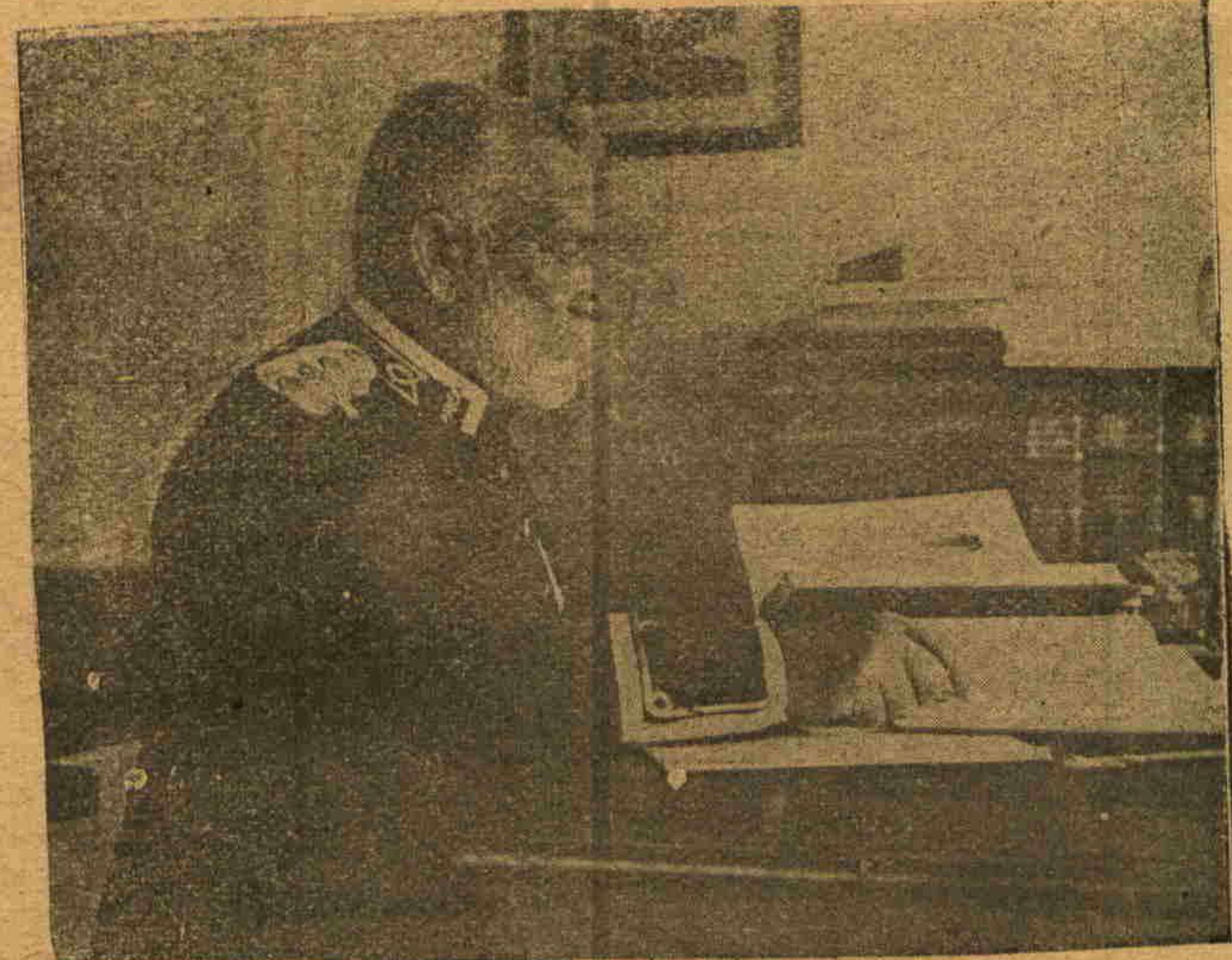
مظهر پاشا طبیه عسکر یاده خواجه ایکن

افاده می ایله وبارلاق بر صورته اثبات ایلدی . بوکون تورکجه تدریس اولان شعبات فنون ایچنده اضطلاع وتعییرلری اک دوزکون ، اک موافق ، اشتقاق واساس اعتباریله اک دوغرو بر فن وارایسه بلاشبهه علم تشریح ر وتورکجه تشریح اصطلاحلرنده کی بو مستفی حیادت