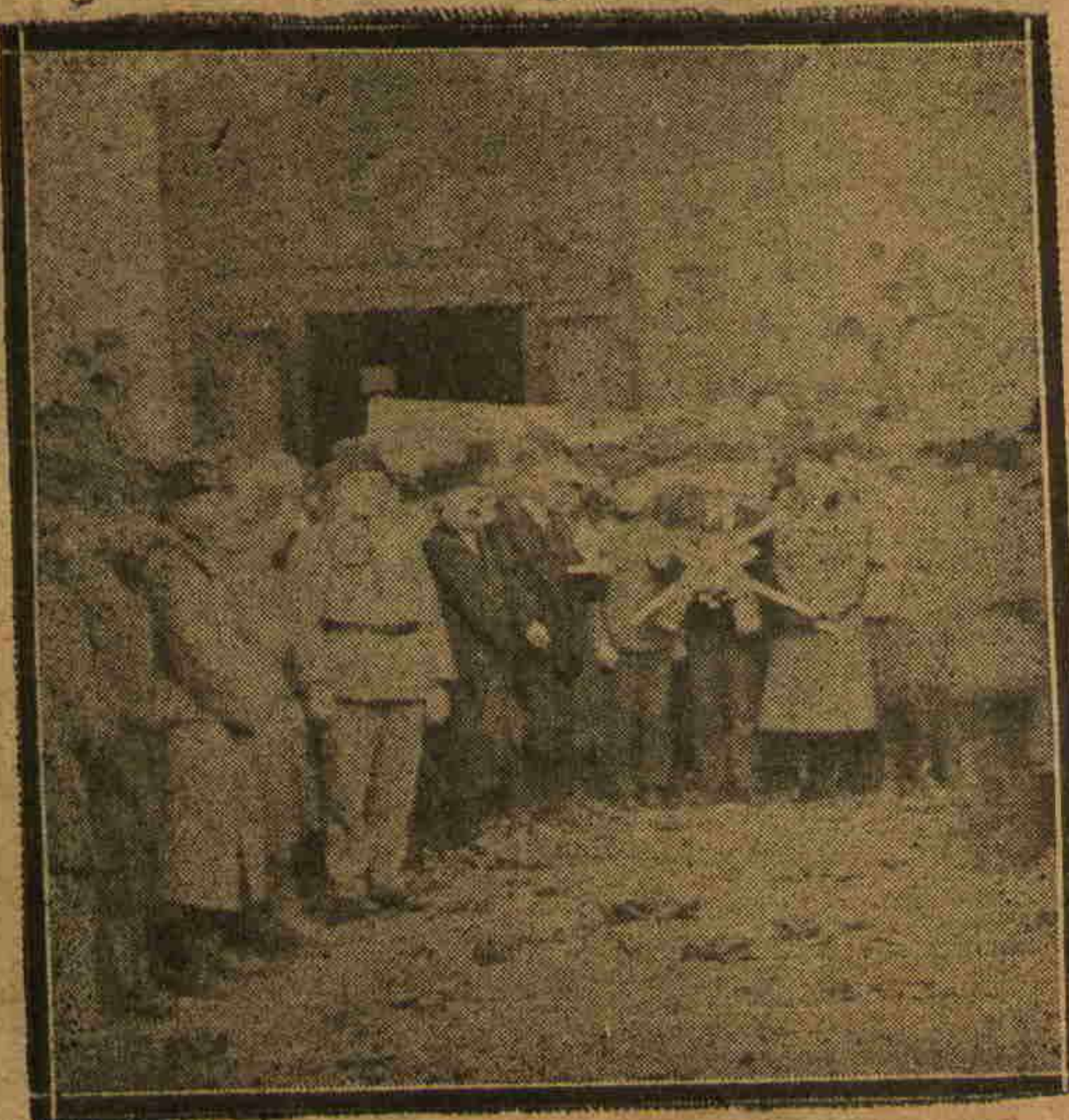
طب فا کولته سنک اوکنده

بیقایور و اونی بر هاله نورله احاطه ایدیوردی... اسکدار جاده سنندن دولاشارق فا کولته اوکنده احضار ایدیلن موقع مخصوصه کتیریلدی. اوراده صیره سیله طلبه دن برملکی و برده عسکری ایکی اقدی ایله فا کولته خواجه لری نامنه رئیس عاقل مختار، عثمانلی طبابت عصبیه و عقلیه و عثمانلی اطبا مخاندنلری جمعیتی نامنه معلم مظهر عثمان بکلرله تشریح خواجه سی نورالدین بک