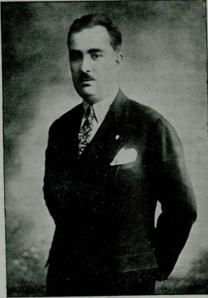
Merhum Eşref Neşet