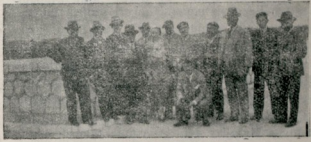
Maraton su bendinde

Hastaneyi tamamen gezdikten sonra müdiriyet odasına alaturka kahve ve şeker ikram edildi. Defteri mahsusu imzalandıktan sonra meslekdaşlarımıza teşekkür ile buradan ayrıldık. Resmi kışadı geçen sene yapılmış olan