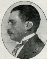
Akil hastalıkları seririyatı profösorü Fahrettin Kerim