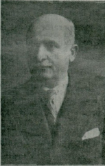
Merhum General Esad

Meşrutiyet inkılâbından evvel tıbbiye askeriye müdürlüğü eden Miralay Esad Bey meşrutiyetin taşkınlıkları zamanında sırf bir karabet yüzünden kendisine vaki olan haksız tecavüzlerden pek müteessir olmuş, lâkin meysus olmamış, haysiyetini dille değil şövalyacasına müdafaa edecek temiz ve centilmen bir hayat geçirmiş, birbirini veli eden harplerde isimleri kahramanlar sınıfında sık sık anılmağa başlamış, mütarekenin o ka-