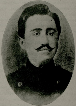
1320 de doktor çıktığı vakit

bir tecrübe ve cesur bir tedavi usulü idi, memleket tababetine ilk defa Gülhane kapısından giriyordu. Yüksek miktarda striknin şırıngalarını korkmadan yapıyorduk, çünkü Mazhar Osman emrediyordu, bir ay sonra hastada tenebbüh alâmetleri görüldü, hasta açıldı. Bir gün eezacının hatası yüzünden 10 santigram striknin birden şırınga edilince hastada tetanoza müşabih arızalar görünmeğe başladı, ölüm pek yakındı, fakat korkmuyorduk, çünkü Mazhar Osman vardı ve netekimde öyle oldu. Hoca