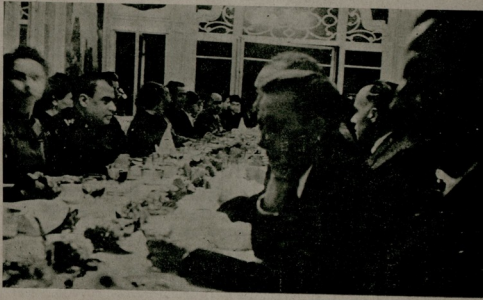
Prof. Mazhar Osman Uzman şerefine verilen ziyafette

Arkadaşlar! müsaade ediniz bu mes'ut günde mistik vazifemi yapayım... Dindarane bir huşu ile beni bu kadar mes'ut bir talie sahip eden Rabbi Halika hamdü senalarımı sunayım... Beni sağlam bir maneviyetle hayat sahnesine getiren, büyüten anacığımı ve babacığımı rahmetle