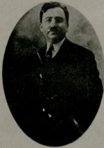
Prof. Mazhar Osman Toptařında Başhekim iken

Aynı günlerde tesis edilen yurda büyük hizmetleri dokunan, vatandařı mübah olduđu zannedilen alkolün bir zehri katil olduđuna