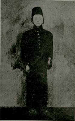
Mazhar Osman Rüştiye mektebinde

sevinirlerdi. Orada şefkatli bir ilim ocağı, bu ocağı tıttüren ve bu zavallı gençlere müşfik ve mahmul aguşlarını açan hocalar bulurlardı. Gülhaneye giden bizim nesiller bu kıymetli hocalar içinde Mazhar Osman 'ı da bulurdu. Bilvesile arza mecburum ki bugün olduğu gibi o tarihlerde de Gülhane mütevazı, iddiasız, fakat yapan ve yaratan bir müessesesi idi. Seririyatları ufaktı. Fakat nadir vak'alarla dolu idi. Poliklinikler, laboratuvarlar fasılasız işlerdi.