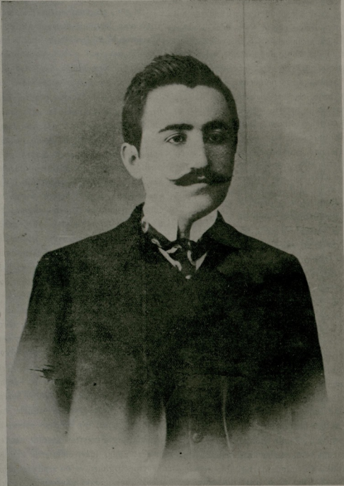
Prof. Mazhar Osman Haseki mecanin müşahedehanesinde başhekim iken

idaresinin takdirkâr kafalarının şuurlu tekâmül isteklerinin yardımı ile az zamanda teessüs etmiş olduğu için, size gayretinizde zahir olan, isteklerinizi tatmin eden bu mes'ut idareye ve