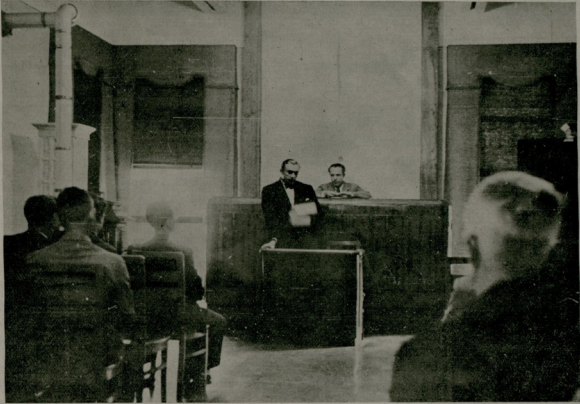
Prof. Mazhar Osman Uzmanın 25 inci başhekimlik senesi şerefine Nöropsikiyatri Cemiyeti tarafından Etüba Odası salonlarında yapılan toplantıda Doktor İhsan Şükrü Aksel nutkunu söylüyor.

belere maruz kalmıştı. O zaman Hoca büyük bir irade ve cesaretle yanındaki gençleri Avrupa'ya gönderdi ve onları emrazi aklıye ve asabiye'nin sade bizde değil bir çok memleketlerde bile mevcut olmayan müteferri şubelerinde ihtisasa sevk etti. Böylece biz Avrupadan avdet ettiğimiz zaman Mazhar Osman mektebi tam kadrosunu bulmuştu. Bir taraftan seroloji, nöropatoloji, psikoloji labratuarları çalı-