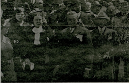
Kongre heyetinin diğer bir resmi