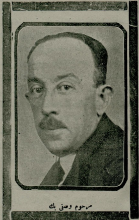
سرحوم وصنی بك

بنه سوک زمانده مؤلفلری اشغال ایدهن بر مسئله شکر سز دیابت و بولی توری عارضه سی تولید ایدهنک