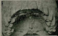
( شکل ۱ ) قارابلی حدیات

۲۳۰ فاحشه دن ۸۷ سنده غایت حیثیت و آشکار قارابلی نظهاراته شاهد اولدم . بونزدن التیش برینک آلرتمدیکی ، فرنیکی تدای کورلری تعقب ایلمدیکی دفترلری واردی . یعنی جمله کی فرنیکی ایله معلول بولتوروردی . دفتر برینک ایچون بالطبع ساری داه الافرنجه دوچار اولری مقتضیدی . بنا برین ، ساپورونک فکرینه کوره اشبو نبارزات حلیم یوبه حقیقت اده الافرنج ولادی ایله علاقه دار ایله ، بوفاحشه لک تکرار فرنیکی به