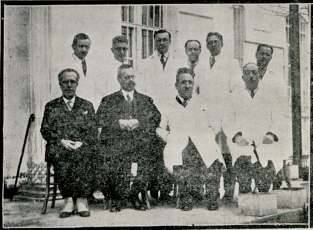
Profesör Waygant Bakır Köy hastanesinde — mütehassıslarla beraber

flört edenler bize hakarete etseler, iftirada bulunsalar pervamız olamaz, kusura bakmasınlar. İstanbul Seririyatı hepsinin fikrine ve kalamine ilk günden sahifalarımı açık tutuyordu. Kolleksiyon meydandadır. İptida bizle beraber olanlar iş buldukça karşıya geçtiler, fakat bir kısmı sade vazifesile iktila etti, bir kısmı mücadelede şerik iken öteden yüz ve yer bulunca bizde, fikrimizde düşman oldu.